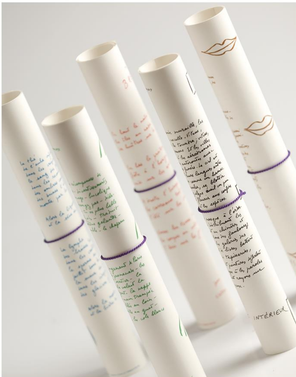
Cinq rouleaux de printemps, livre-objet réalisé par Michel Butor & Arches (éditeur), 1984

Exposition conçue à partir de la collection du Manoir des livres