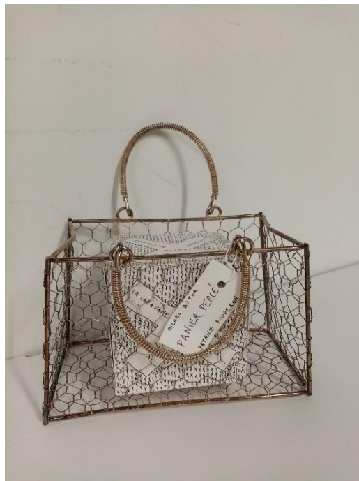
Panier percé , Michel Butor et Patrice Poupon, 2002, collection Manoir des livres