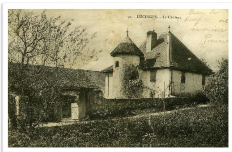
Carte postale, archive bibliothèque Michel Butor

La rénovation du bâtiment, qui avait déjà abrité 7 expositions entre 2009 et 2014, a été conduite par l'architecte du patrimoine Guy Desgrandchamps, suite à une commande communale. Les travaux ont duré presque deux ans.