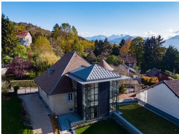
Le Manoir des livres après rénovation, 2019

Il prend place au sein de l'Archipel Butor, composé également d'une bibliothèque de lecture publique et de la maison de l'écrivain, espace de résidences d'artiste depuis octobre 2020.