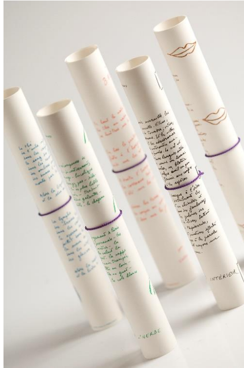
Cinq rouleaux de Printemps , Michel Butor, édition Arches, 1984, collection Manoir des livres