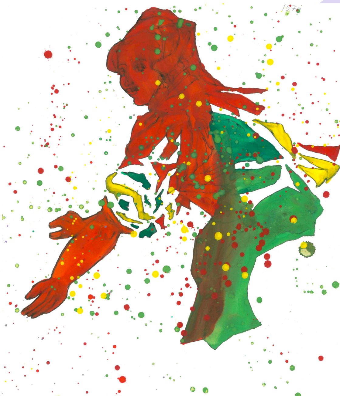
Marchande aux poissons, lavis de Colette Deblé