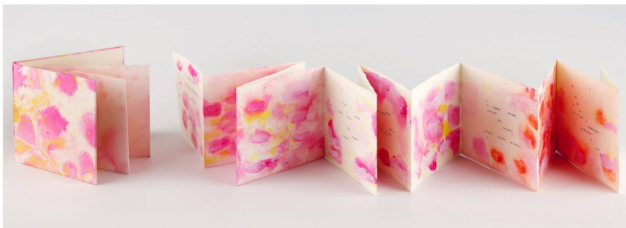
Éclats de roses , par Roland Chopard et Colette Deblé, aux éditions Encrages & Co, 1989, 15 exemplaires ©Gérard Cottet