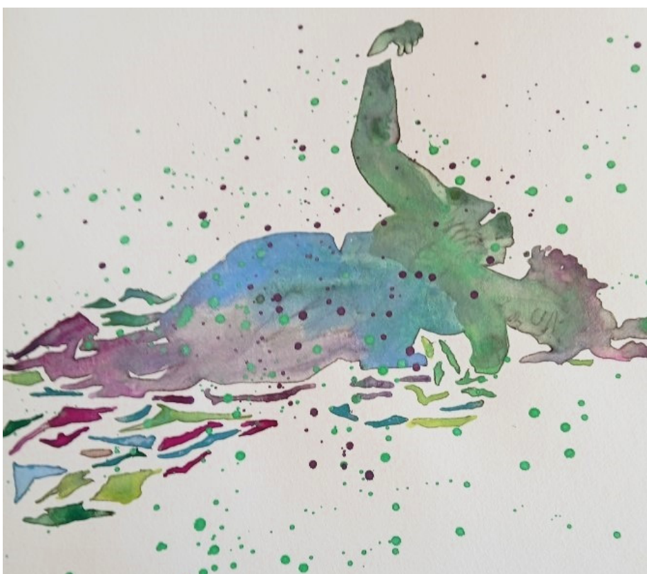
Lavis de Colette Deblé