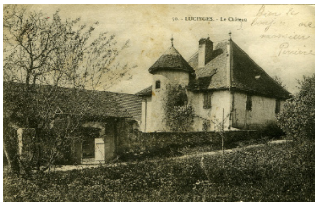
Carte postale, archive de la bibliothèque Michel Butor ©DR

La rénovation du bâtiment, qui avait déjà abrité sept expositions entre 2009 et 2014, a été conduite par l'architecte du patrimoine Guy Desgrandchamps, suite à une commande communale. Les travaux ont duré presque deux ans.