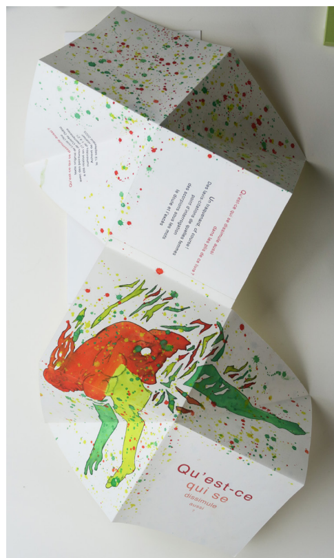
Qu'est-ce qui se dissimule aussi, par Louis Dire et Colette Deblé, aux éditions Écarts, 2023