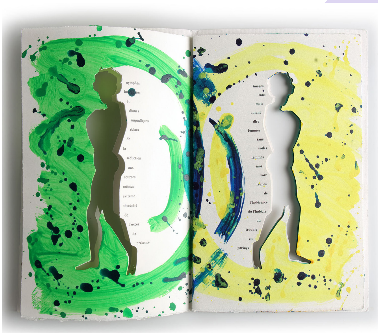
Qu'est-ce que ça raconte ? , par Louis Dire et Colette Deblé, aux éditions Encre & Co