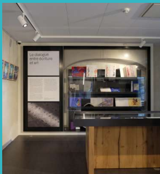
Manoir des livres

L'Archipel Butor propose également des balades butoriennes dans les environs de Lucinges.