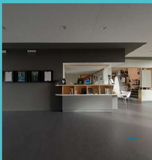
Manoir des livres - Accueil

Les ateliers se déroulent dans notre espace pédagogique.