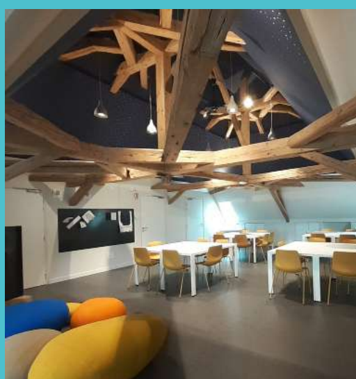
Manoir des livres - Espace pédagogique