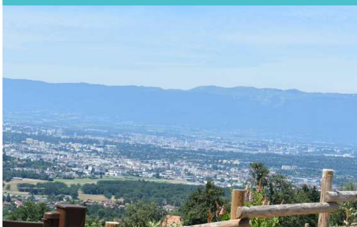
Vue depuis la balade butorienne