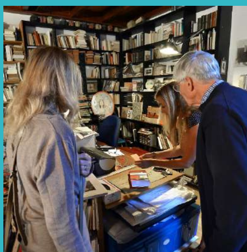
Bureau de Michel Butor